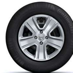
15" PLIENINIAI RATLANKIAI POPSTER**