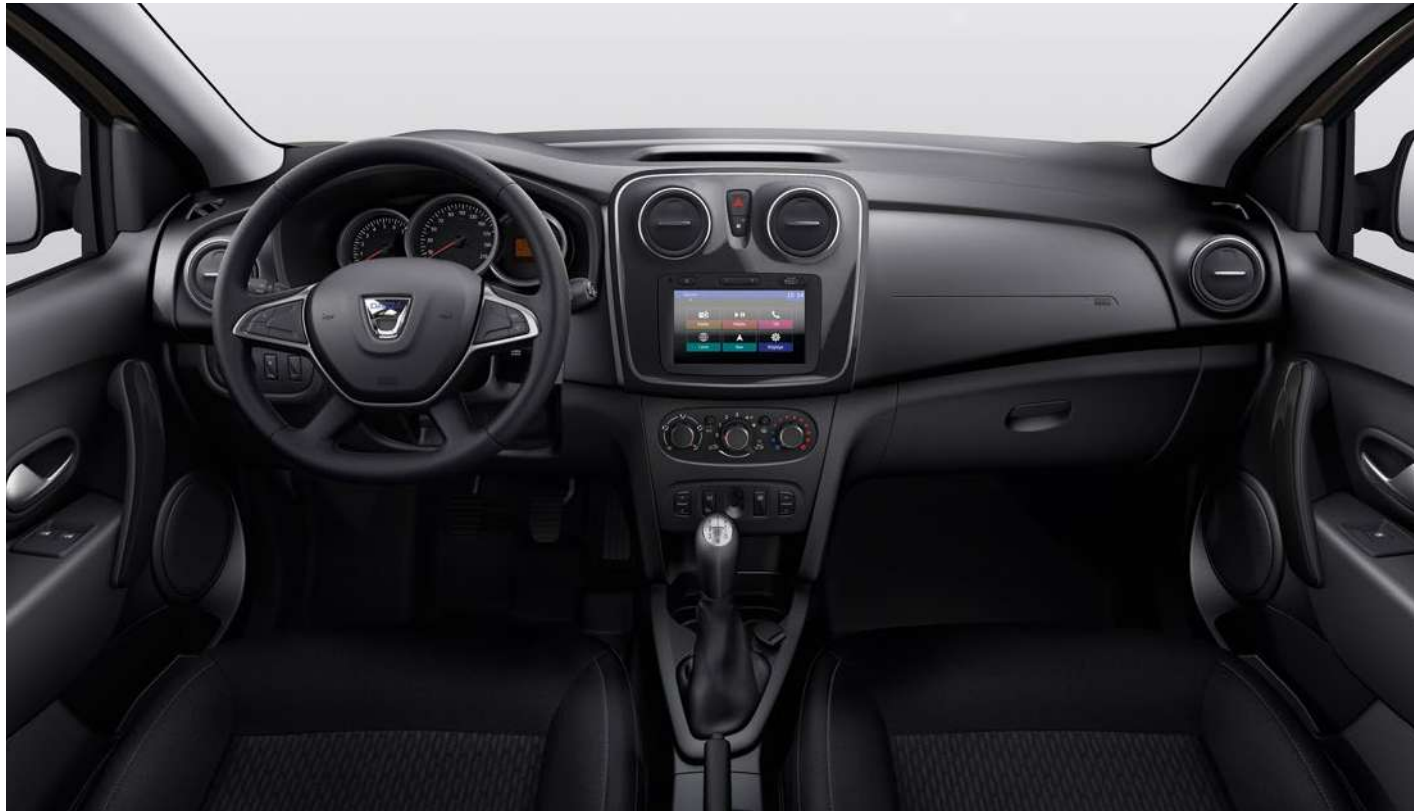
Nuotraukoje parodytas salonas su pasirinkama įranga (įskaitant Media Nav Evolution )