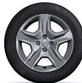
16" LENGVOJO LYDINIO RATLANKIAI BAYADERE*