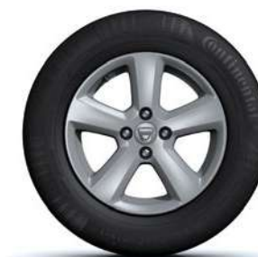
15" LENGVOJO LYDINIO RATLANKIAI CHAMADE***