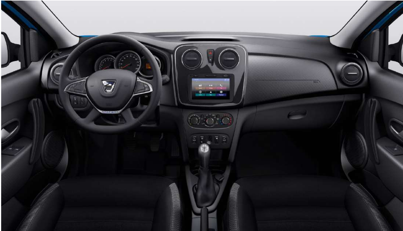
Nuotraukoje parodytas salonas su pasirinkama įranga (įskaitant Media Nav Evolution)