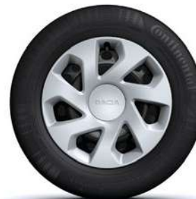
15" PLIENINIAI RATLANKIAI GROOMY**