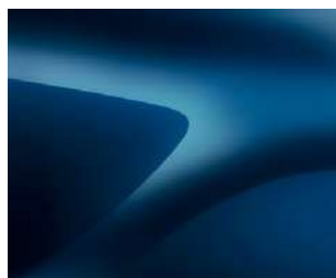
KOSMOSO MĒLYNA (RPR) 2