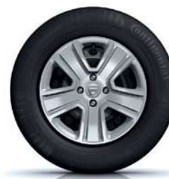
15" RATŲ GAUBTAI POPSTER*