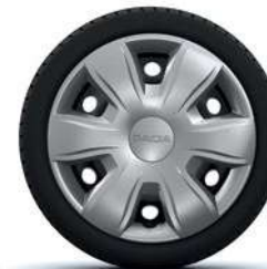
15" RATŲ GAUBTAI TISA*