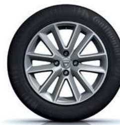
16" ALIUMININIAI ALTICA RATŲ RATLANKIAI**