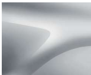
AUKŠTUMŲ PILKA (KQA) 2