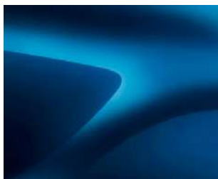
AZURITO MĒLYNA (RPL) **2

(1) Nemetalizuojamosios spalvos (2) Metalizuojamosios spalvos * Netaikoma variantui STEPWAY. ** Taikoma tik variantui STEPWAY.