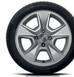
15" ALIUMININIAI RATLANKIAI NEPTA*