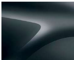
KOMETOS PILKA (KNA) 2