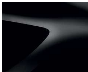
JUODASIS PERLAS (676) 2