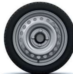
14" MINI RATŲ GAUBTAI