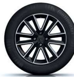
16" ALIUMINIAI RATLANKIAI ALTICA, JUODOS SPALVOS SU DEIMANTŲ BLIZGESIU**