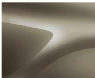
KOPŲ SMĒLIS (HNP) 2