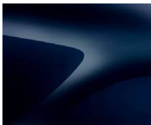
JŪROS MĒLIS (D42) *1