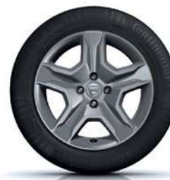
16" TAMSAUS METALO SPALVOS RATLANKIAI BAYADERE**