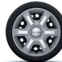
15" RATŲ GAUBTAI ARACAJU*